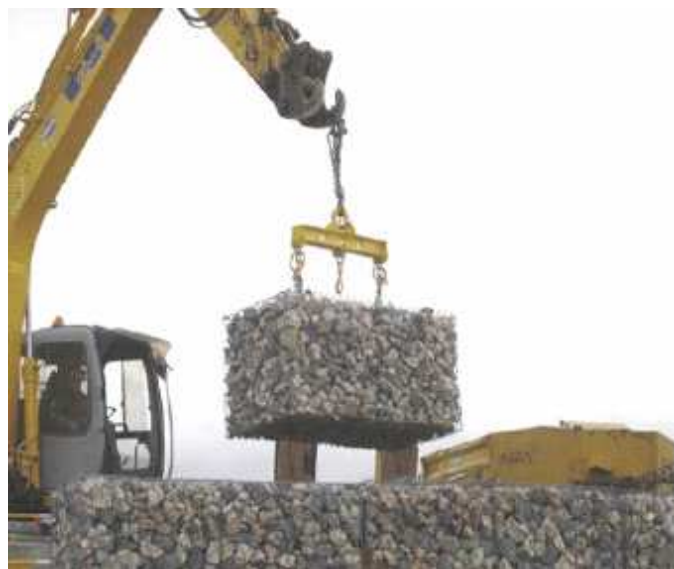
Dispositifs de préhension

Pierres de remplissage : Vibro compactées en carrières Elingue : suivant la norme EN 1492-2